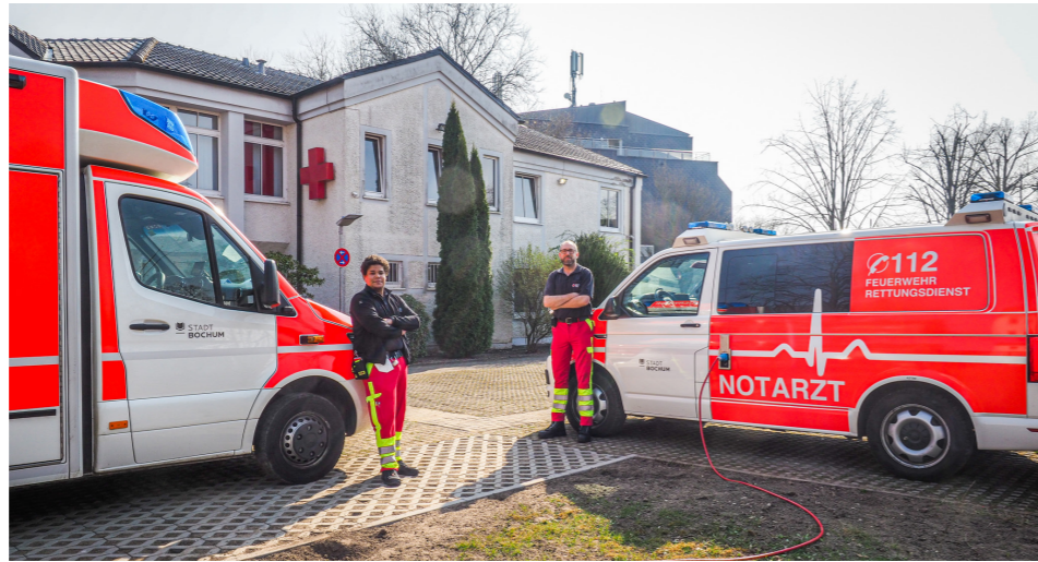
Die Rettungswache IV ist nun für ca. zwei Jahre an der Holtbrücke zu finden.

Circa zwei Jahre beherbergt das DRK nun die Mitarbeiterinnen und Mitarbeiter des Rettungs-