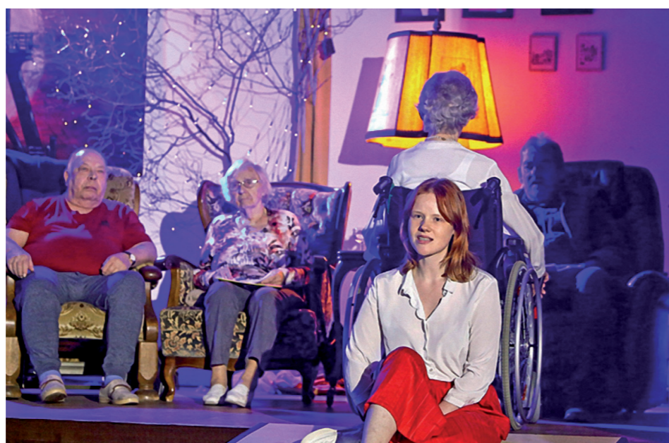
Bei dem Projekt können die Teilnehmenden aktiv Theaterluft schnuppern.

Haben wir Ihr Interesse geweckt? Dann schauen Sie gerne unverbindlich an einem der Auftaktermine teil. Fragen Sie den Sozialen Dienst nach weiteren Informationen. (jm)