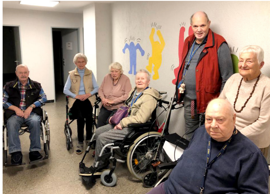
Im Mai 2022 läuft die Amtszeit des derzeitigen Heimbeirats ab.

Der Heimbeirat, als vom Gesetz vorgesehene Mitwirkungsorgan der Bewohnerinnen und Bewohner, ist ein wichtiger Gesprächs- und Verhandlungspartner für den Heimträger und die Heimaufsicht. Daher ist eine zahlreiche Wahlbeteiligung besonders wichtig.