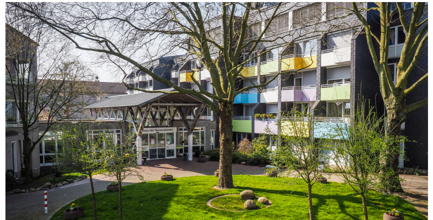
Der Heimbeirat vertritt alle Bewohnerinnen und Bewohner des „Haus der Generationen“.

Werden auch Sie Mitglied im Heimbeirat! Wir freuen uns darauf, Sie im Heimbeirat begrüßen zu dürfen! (jm)