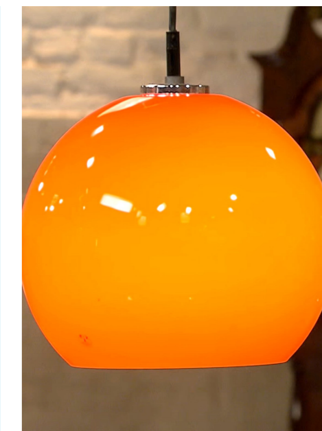
70er-Jahre-Design ist wieder gefragt.

Die Sendung „Bares für Rares“ wird seit 2013 produziert und sehr erfolgreich im Nachmittagsprogramm ausgestrahlt.