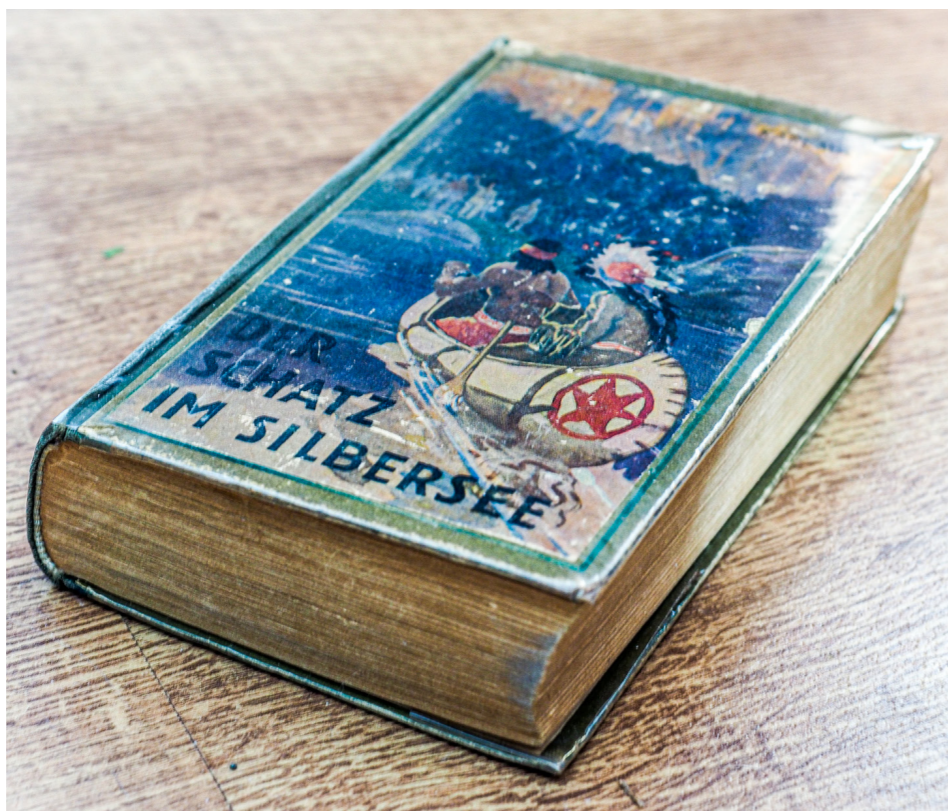
„Der Schatz im Silbersee“ von Karl May begeisterte schon als Buch Jugendliche seit 1891.

Spätestens mit diesem Film hat sich Audrey Hepburn unsterblich gemacht. Das Bild der eleganten schlanken Frau mit der Zigaretzenspitze, die das Leben in vollen Zügen genießt, kennt bestimmt jeder. Diese bittersüße Liebesgeschichte bleibt auch durch das