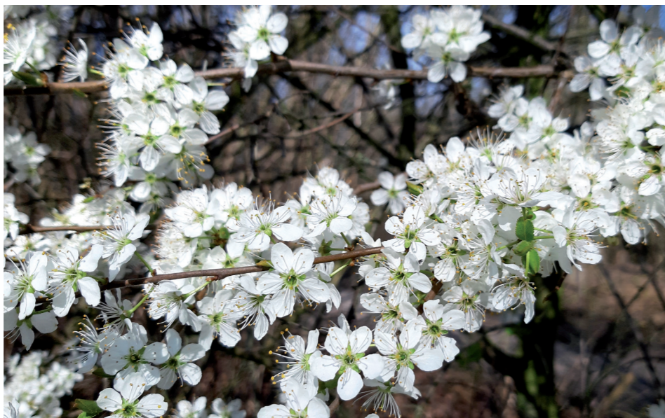
Den Schwarzdorn, oder auch die Gewöhnliche Schlehe, findet man zum Beispiel im Springorum-Park hinter dem „Haus der Generationen“.

Die gelb leuchtenden Köpfe der Osterglocke sind wie jedes Frühjahr ganz vorne mit dabei. Sie kämpfen sich als eine der ersten erfolgreich ihren Weg durch Laub und Gras. Wer kennt sie nicht, die Osterglocke, auch bekannt als Gelbe Narzisse. Sie ist ein Klassiker unter den Frühlingsblühern, heimisch auf den feuchten Bergwiesen Westeuropas und liebt feuchten, sandigen