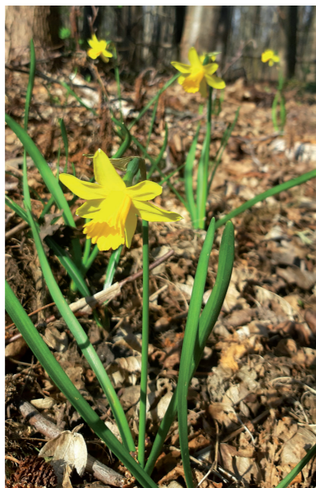
Die Osterglocke wagt sich im Frühling als eine der ersten Blumen heraus.

Boden und einen halbschattigen Standort. Als Schnittblume eignet sie sich hervorragend für einen frischen Blumengruß in der Vase.