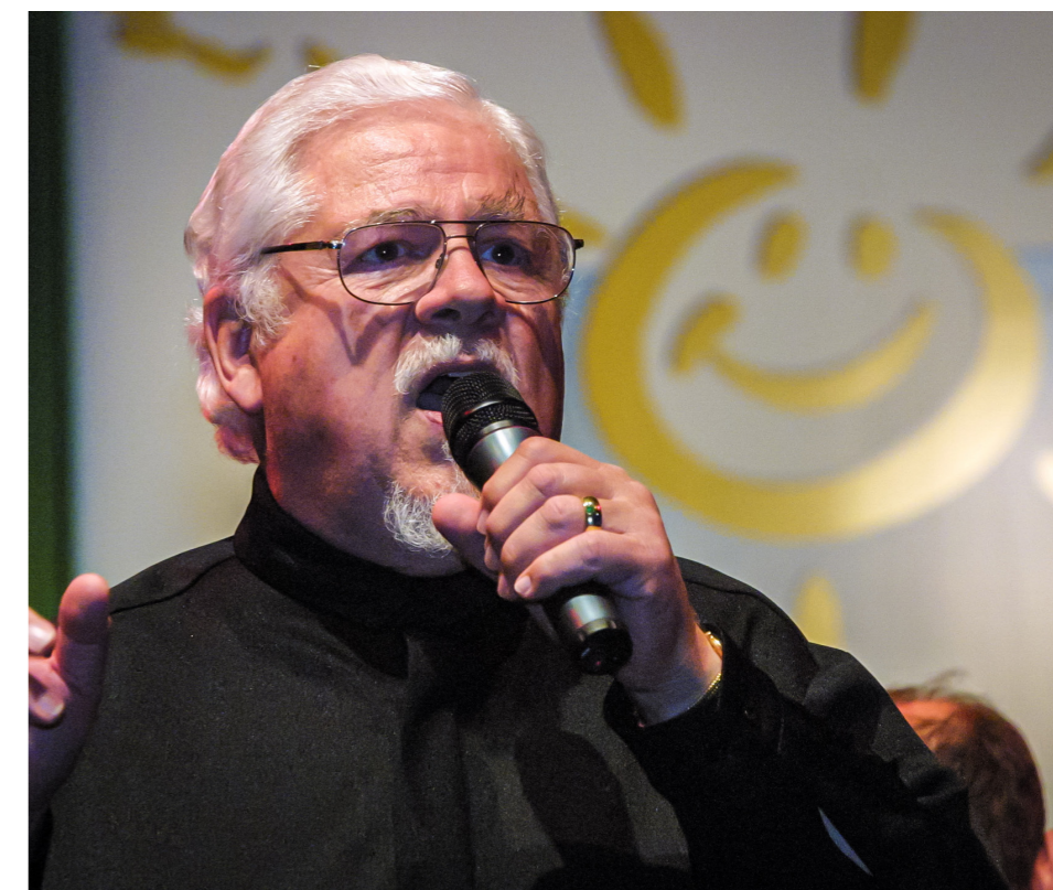
Bill Ramseys Lied war titelgebend für den Film: „Ohne Krimi geht die Mimi nie ins Bett“

Auch dieser Film ist von 1962. Und schon beim Hören des Titels hat man das gleichnamige Lied von Bill Ramsey im Ohr. Auch wenn Kritiker sagen, es wäre sehr seichte Unterhaltung, kann man mit dieser Verwechslungskomödie viel Spaß haben, spielten doch Heinz Erhardt, Karin Dor, Harald Juhnke, Edith Hancke und Trude Herr mit.